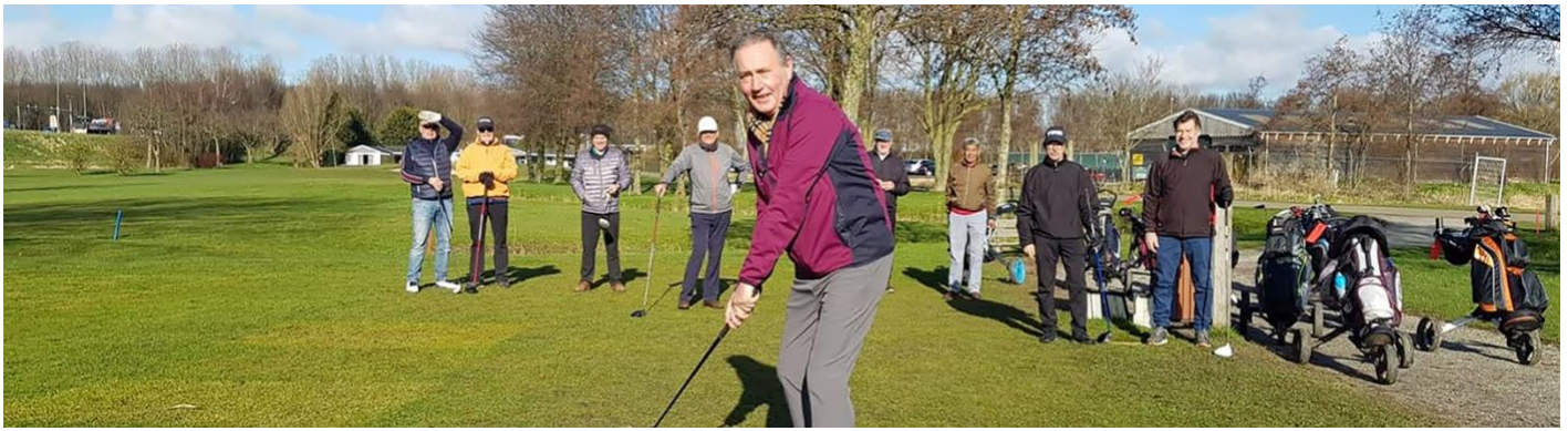
Golffoto 2 van de maand maart: "Opening van het seizoen 2021". Ingestuurd door Rick