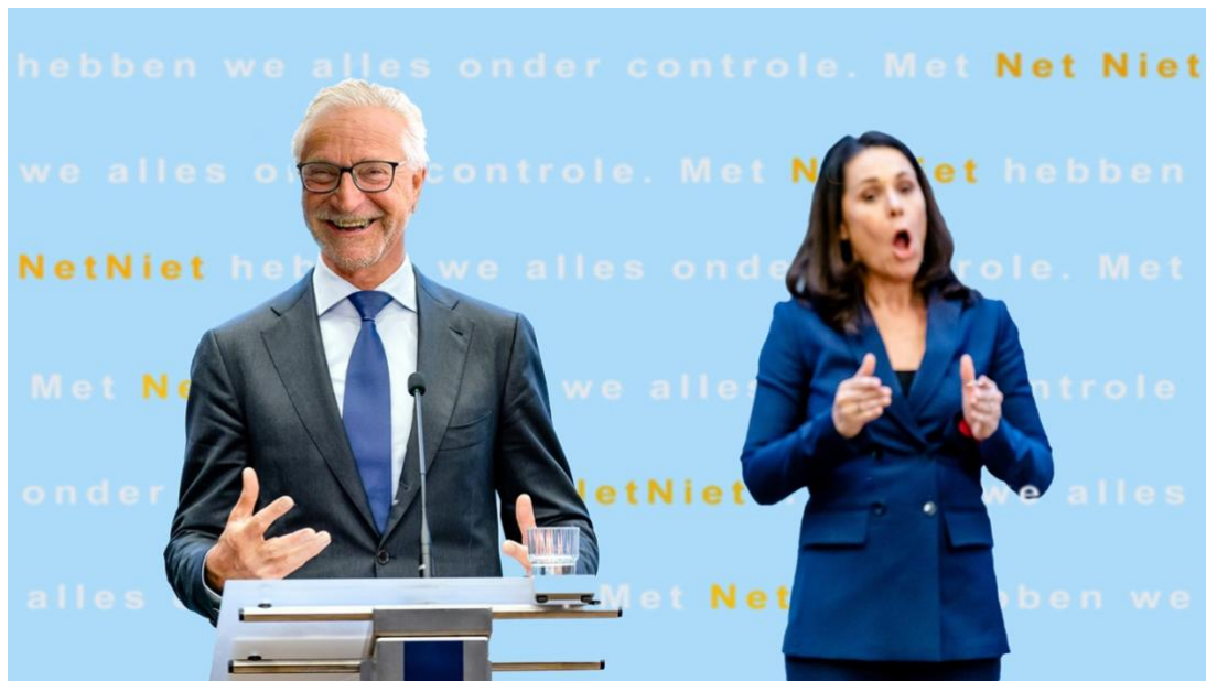
Persconferentie NetNiet, februari 2021