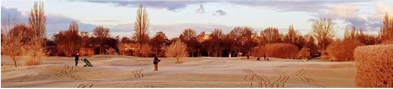
Nieuwsbrief 01 - januari 2021

Golffoto van de maand januari: "Amsteldijk"