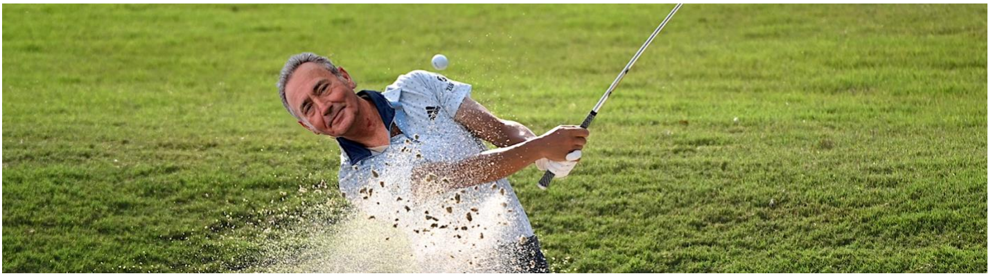
Golffoto van de maand maart: "AMVJ". Ingestuurd door Rick.