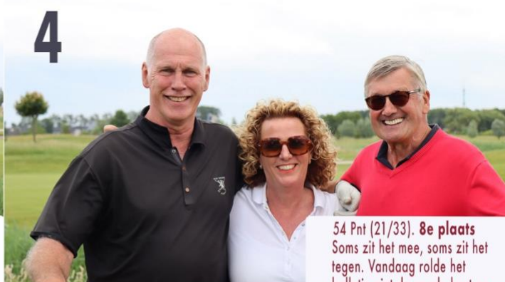
54 Pnt (21/33). 8e plaats Soms zit het mee, soms zit het tegen. Vandaag rolde het balletje niet de goede kant op.