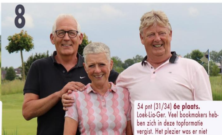
54 pnt (31/34) 6e plaats. Loek-Lia-Ger. Veel bookmakers hebben zich in deze topformatie vergist. Het plezier was er niet minder om.